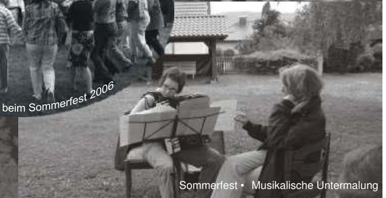
Sommerfest • Musikalische Untermalung