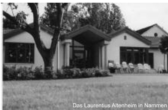
Das Laurentius Altenheim in Nammen