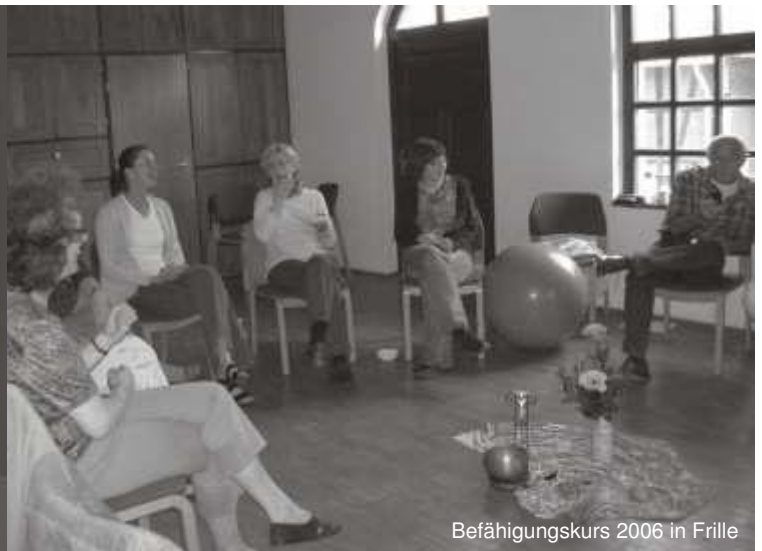
Befähigungskurs 2006 in Frille