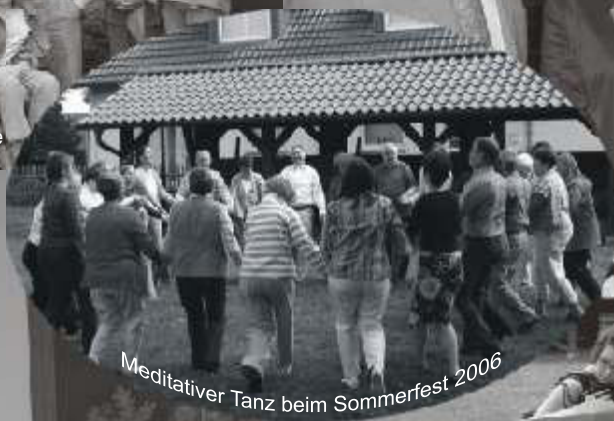
Meditativer Tanz beim Sommerfest 2006