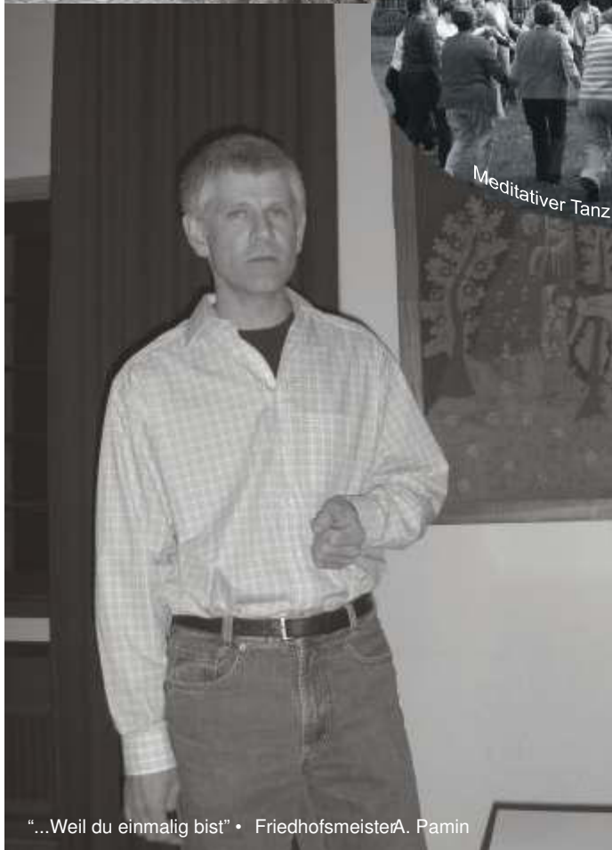
"...Weil du einmalig bist" • FriedhofsmeisterA. Pamin