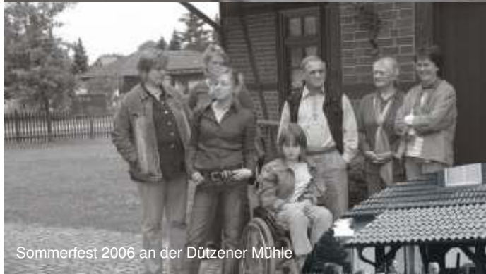
Sommerfest 2006 an der Dützener Mühle